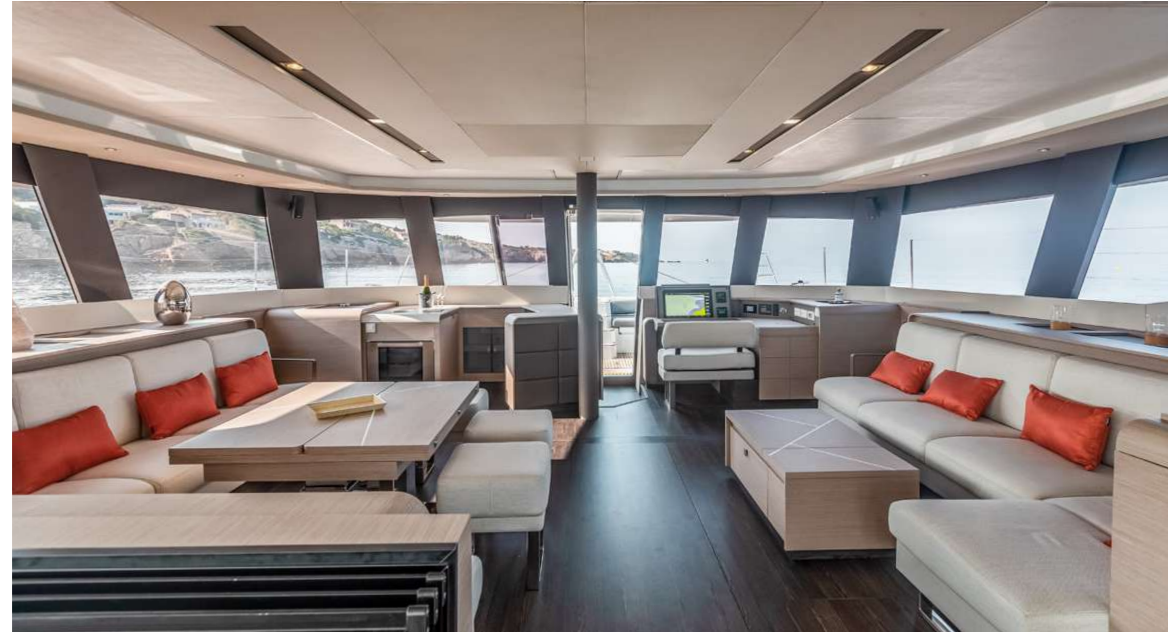
Galley down version