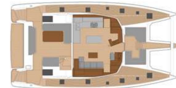
CLASSIC MAIN DECK